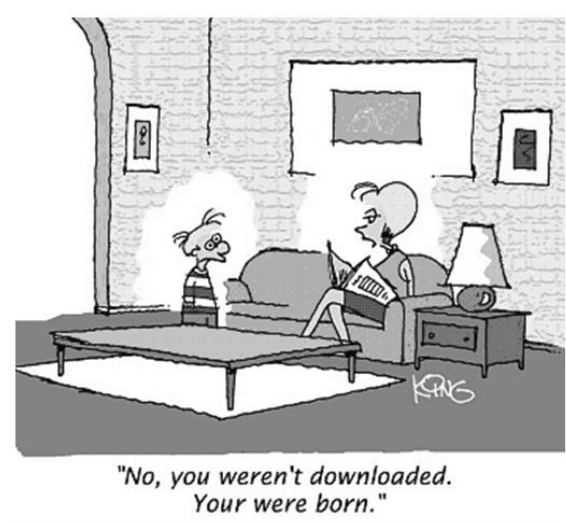
Figura 1: Uma figura típica

As legendas das figuras e tabelas devem ser centralizadas se houver menos de uma linha (Figura 1), caso contrário justificadas e recuadas em 0,8cm em ambas as margens, conforme mostrado na Figura 2. A fonte da legenda deve ser Helvetica, 10 pontos, negrito, com 6 pontos de espaço antes e depois de cada legenda.