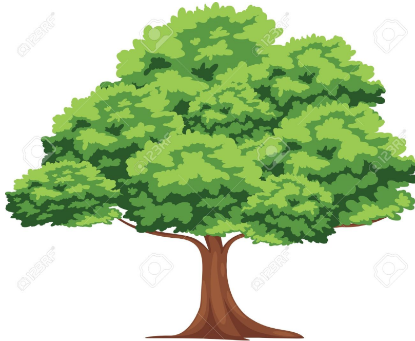
Plate 2.1: This is an example of a single image plate.