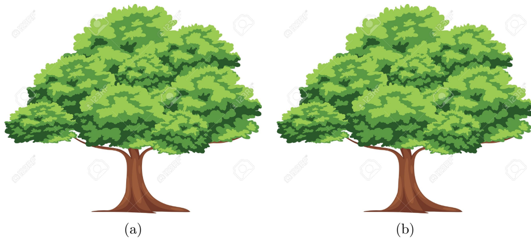
Figure 2.1: This is an example of a double image figure.