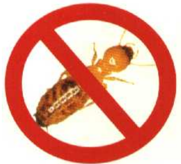
FIGURE 1.1 – Proibido estacionar cupins. Legenda grande, com o objetivo de demonstrar a indentação na lista de figuras.

Após a ocorrência de uma falha em um de seus atuadores, o manipulador torna-se um sistema subatuado. Um sistema também pode se tornar subatuado quando é projetado dessa maneira, ou quando o operador deliberadamente mantém um ou mais atuadores disponíveis inoperantes durante uma tarefa. Reduzindo o número de atuadores sem reduzir o número de graus de liberdade e ajustando-se o sistema de controle adequado, pode-se obter um mecanismo cujo consumo de energia é menor, mas cujas propriedades são mantidas (ARYSTIDES; MEDEIROS, 1995).