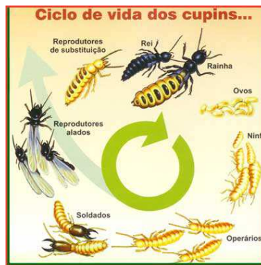
FIGURE A.1 – Uma figura que está no apêndice