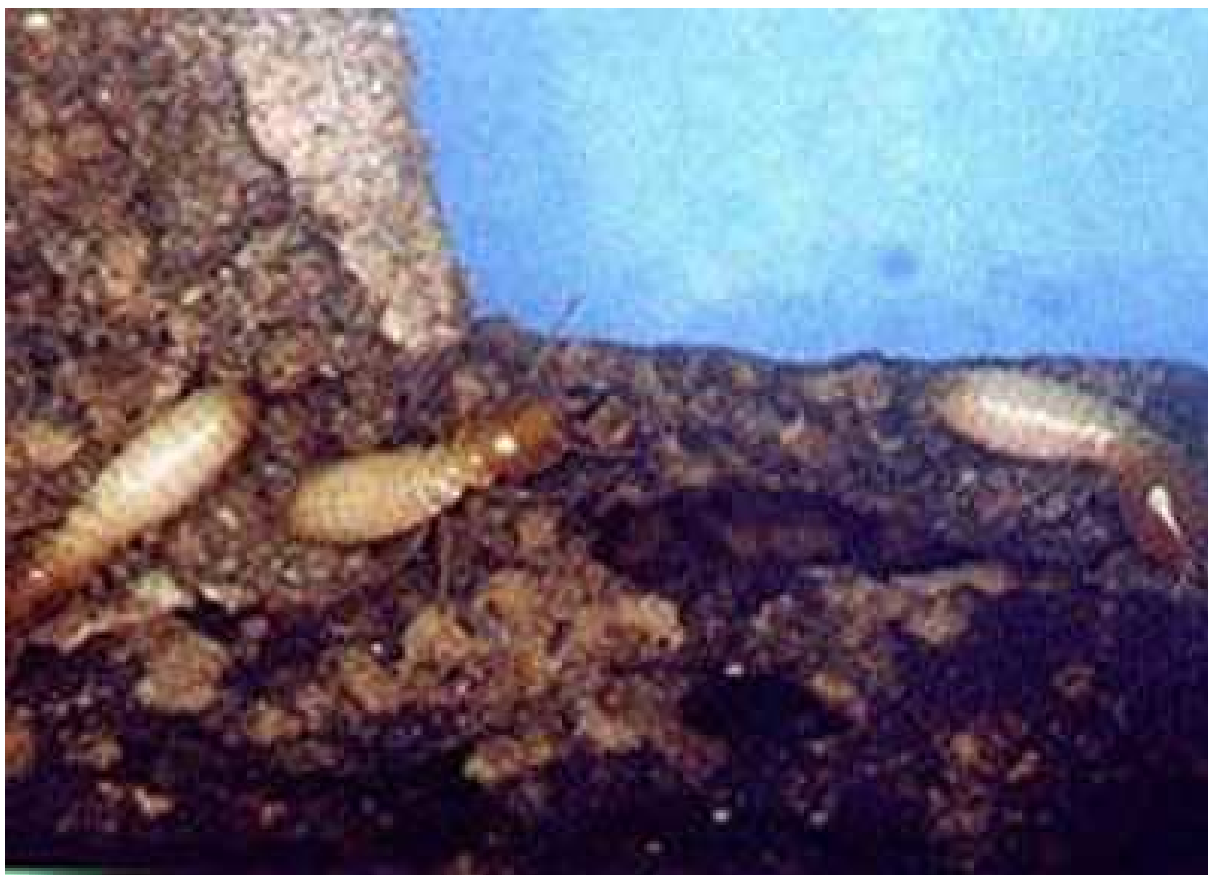
FIGURE 1.2 – Exemplo real de cupim frente ao seu dilema.

Segundo, o critério de otimização utilizado será o acoplamento entre as juntas do manipulador e neste caso, temos um sistema redundante quando ocorre falha de uma das juntas do manipulador de três juntas, e seu posicionamento é controlado pelas duas restantes. Nossa solução para o problema é baseada na formulação de redundância local, extensivamente estudada no contexto de cinemática inversa (nakamura). A principal contribuição deste trabalho é a extensão deste método usando as equações dinâmicas de manipuladores subatuados e a utilização do índice de acoplamento como um critério para a minimização do torque e da energia gasta pelo sistema durante o controle das juntas falhas.