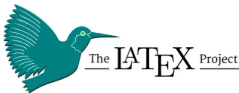
Figura 2.1 – Exemplo de como inserir Figura