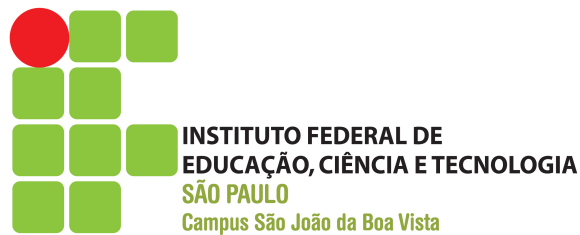
Figura 1 – Exemplo de figura

Este é um exemplo de como usar figuras. Referência cruzada: Figura 1