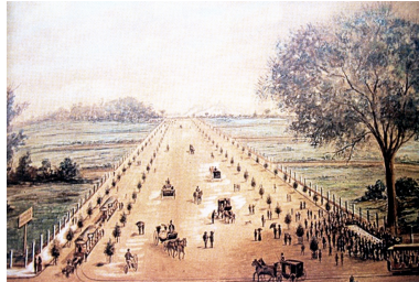
Figure 1: Lookit! Lookit!