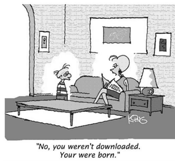
Figura 1. A typical figure

Tabelas e figuras possuem numeração independente, que deve ser feita sequencialmente na ordem em que são citadas no texto. Devem também ter uma legenda auto-explicativa, sendo que as tabelas terão legendas na parte superior e as figuras as terão na parte inferior, centralizadas em relação à tabela ou figura. A legenda inicia com o termo "Tabela" ou "Figura" (primeira letra em maiúscula), de acordo com o caso, seguido de um espaço e do número de ordem sequencial, em algarismos arábicos, seguido de hífen entre espaços e do texto da legenda, com a primeira letra da primeira palavra em maiúscula e as demais em minúscula, exceção feita àquelas que normalmente são escritas em maiúsculas. Devem ser citadas no texto como "Tabela 1" e "Figura" seguidas de espaço e do número correspondente.