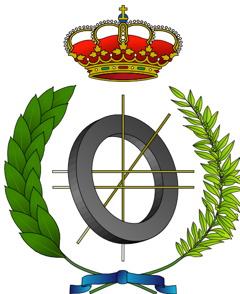
Figura 1.1: Figura vectorial del escudo de la ESI

En esta sección se añaden ejemplos de muestra para la inclusión de figuras simples y subfiguras.