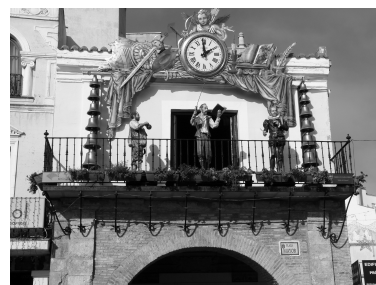
(b) Fotografía en blanco y negro