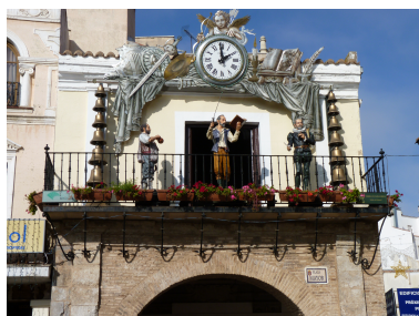
(a) Fotografía a color

Ejemplo de figuras compuestas por subfiguras incluidas con paquete subcaption. 1