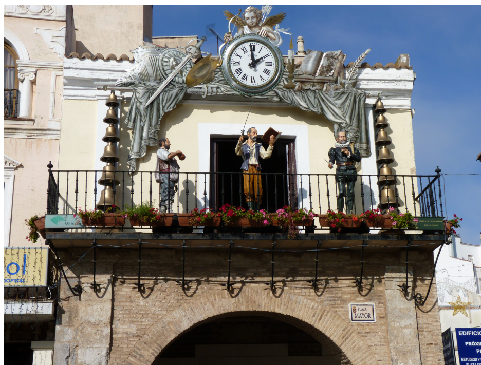
Figura 1.1: Fotografía a color

En esta sección se añaden ejemplos de muestra para la inclusión de figuras simples y subfiguras.