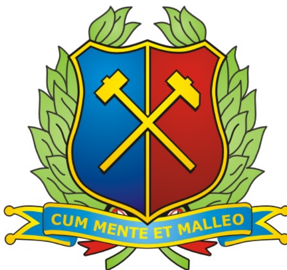
Figura 1.1: Exemplo Figura

Exemplo de como a figura e a citação vão aparecer no texto: “A Figura 1.1 é . . .”.