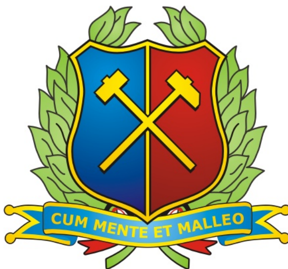
Figura 1.1: Exemplo Figura

Exemplo de como a figura e a citação vão aparecer no texto: “A Figura 1.1 é . . .”.