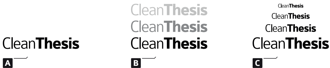
Fig. 3.1: Figure example: (a) example part one, (c) example part two; (c) example part three

ullamcorper, felis non sodales commodo, lectus velit ultrices augue, a dignissim nibh lectus placerat pede. Vivamus nunc nunc, molestie ut, ultricies vel, semper in, velit. Ut porttitor. Praesent in sapien. Lorem ipsum dolor sit amet, consectetur adipiscing elit. Duis fringilla tristique neque. Sed interdum libero ut metus. Pellentesque placerat. Nam rutrum augue a leo. Morbi sed elit sit amet ante lobortis sollicitudin. Praesent blandit blandit mauris. Praesent lectus tellus, aliquet aliquam, luctus a, egestas a, turpis. Mauris lacinia lorem sit amet ipsum. Nunc quis urna dictum turpis accumsan semper. Lorem ipsum dolor sit amet, consectetur adipiscing elit. Etiam lobortis facilisis sem. Nullam nec mi et neque pharetra sollicitudin. Praesent imperdiet mi nec ante. Donec ullamcorper, felis non sodales commodo, lectus velit ultrices augue, a dignissim nibh lectus placerat pede. Vivamus nunc nunc, molestie ut, ultricies vel, semper in, velit. Ut porttitor. Praesent in sapien. Lorem ipsum dolor sit amet, consectetur adipiscing elit. Duis fringilla tristique neque. Sed interdum libero ut metus. Pellentesque placerat. Nam rutrum augue a leo. Morbi sed elit sit amet ante lobortis sollicitudin. Praesent blandit blandit mauris. Praesent lectus tellus, aliquet aliquam, luctus a, egestas a, turpis. Mauris lacinia lorem sit amet ipsum. Nunc quis urna dictum turpis accumsan semper.