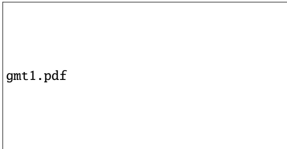
FIGURE 3 – Comme la Fig 1, mais en draft.