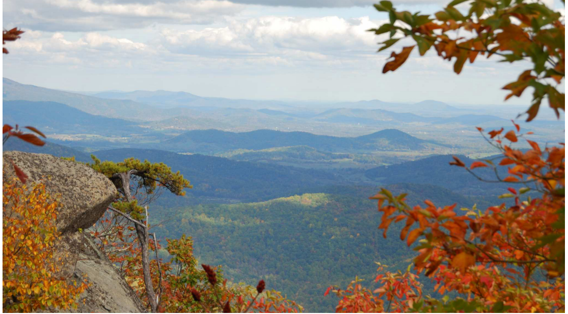
Figure 1. An example image.