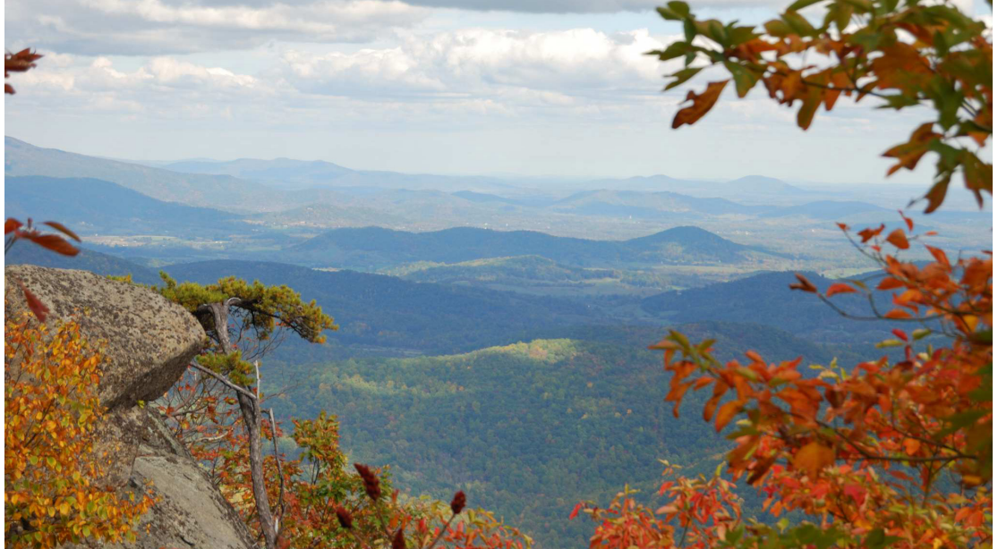
Figure 1. An example image.