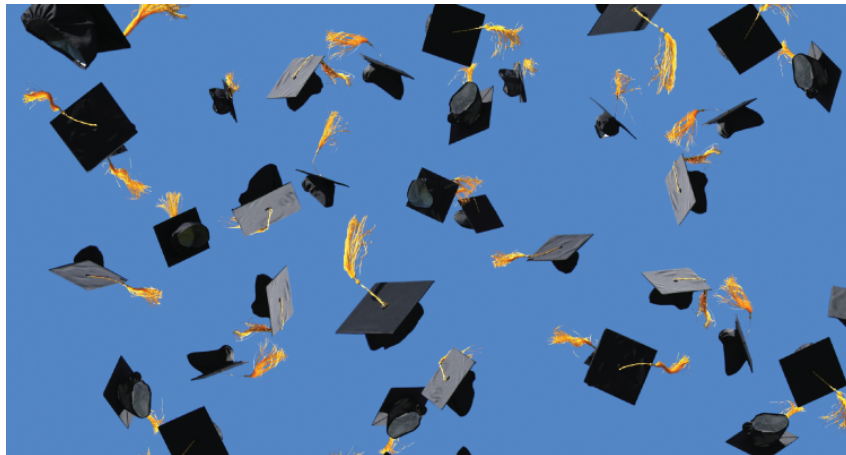
Figura 1 – Mãe, eu formei!

Lorem ipsum dolor sit amet, consectetur adipiscing elit. Aenean commodo ligula eget dolor. Aenean massa. Cum sociis natoque penatibus et magnis dis parturient montes, nascetur ridiculus mus. Donec quam felis, ultricies nec, pellentesque eu, pretium quis, sem. Nulla consequat massa quis enim. Donec pede justo, fringilla vel, aliquet nec, vulputate eget, arcu. In enim justo, rhoncus ut, imperdiet a, venenatis vitae, justo. Nullam dictum felis eu pede mollis pretium.