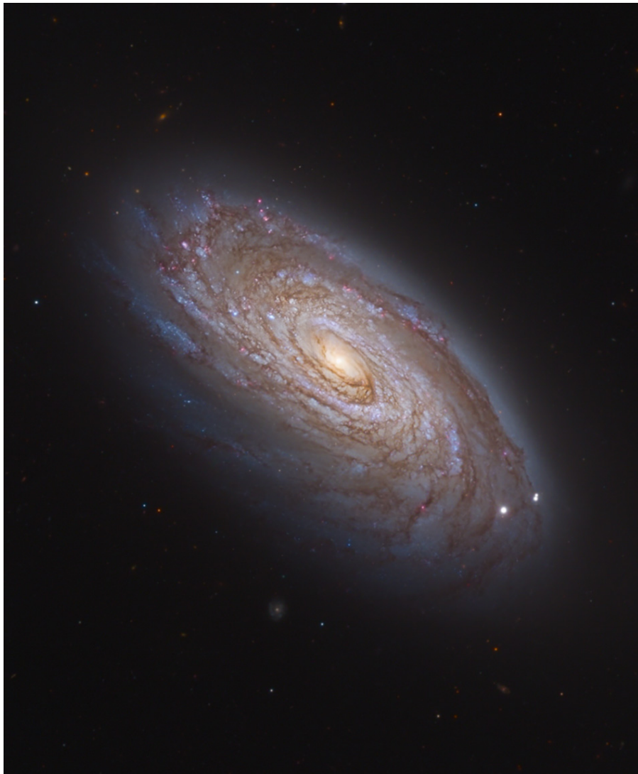
圖 1.M88 是距離我們約 5 千萬光年遠的室女星系團。

和平和平和平和平和平。見圖 1，和平和平和平和平和平，和平和平和平和平和平，和平和平和平和平和平和平，和平，和平和平和平和平和平和平和平和平，和平和平和平和平和平和平。和平和平和平，和平和平和平和平和平，和平和平和平和平和平和平和平和平，如圖 2，和平和平和平和平和平和平和平和平和平，和平和平和平和平和平 (王瑞璦，2022)。