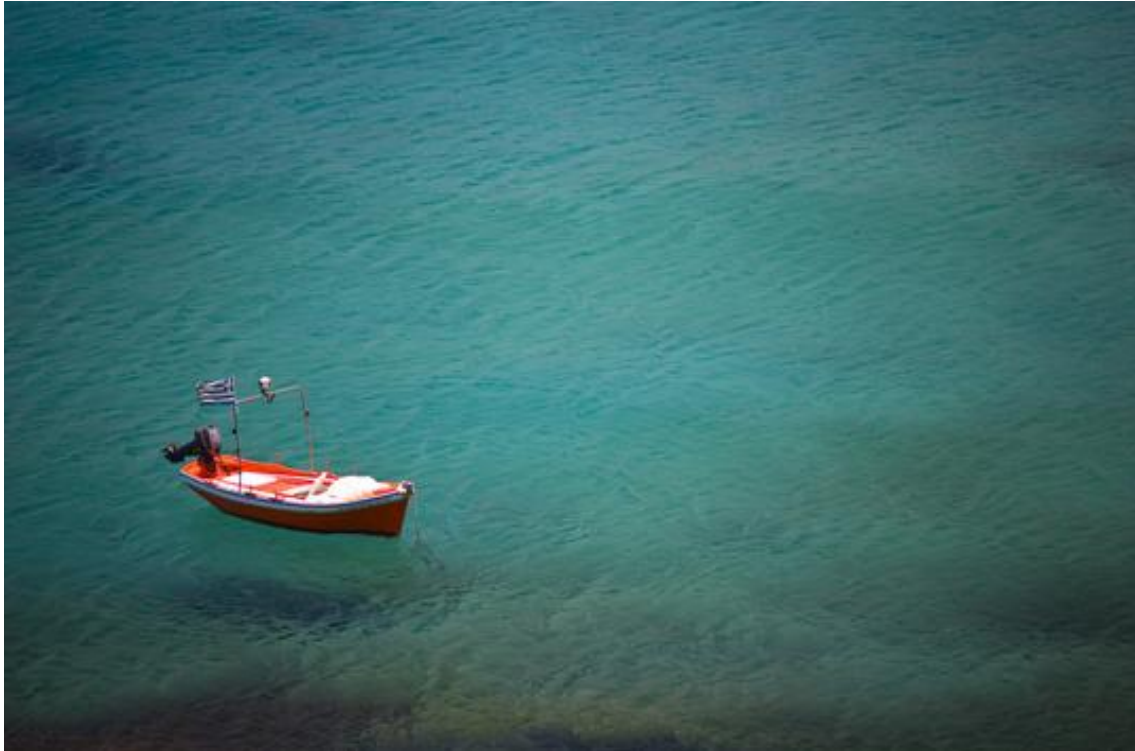
Slika 1.1: Primer slike

in reprehenderit in voluptate velit esse cillum dolore eu fugiat nulla pariatur. Excepteur sint occaecat cupidatat non proident, sunt in culpa qui officia deserunt mollit anim id est laborum.