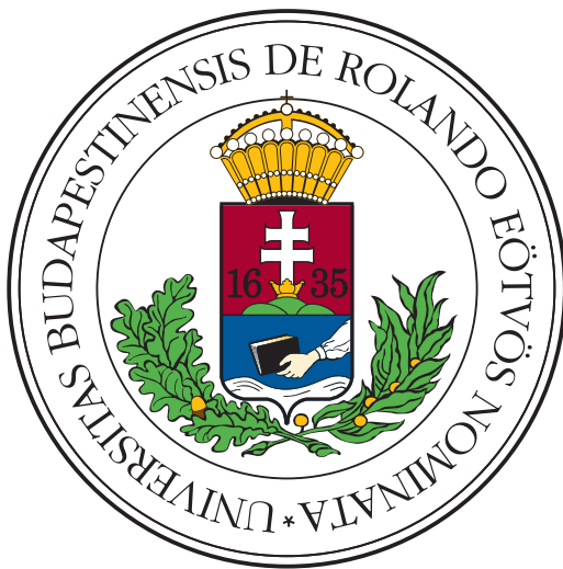
(a) Vestibulum quis mattis urna

In non ipsum fermentum urna feugiat rutrum a at odio. Pellentesque habitant morbi tristique senectus et netus et malesuada fames ac turpis egestas. Nulla tincidunt mattis nisl id suscipit. Sed bibendum ac felis sed volutpat. Nam pharetra nisi nec facilisis faucibus. Aenean tristique nec libero non commodo. Nulla egestas laoreet tempus. Nunc eu aliquet nulla, quis vehicula dui. Proin ac risus sodales, gravida nisi vitae, efficitur neque, Figure 2.3: