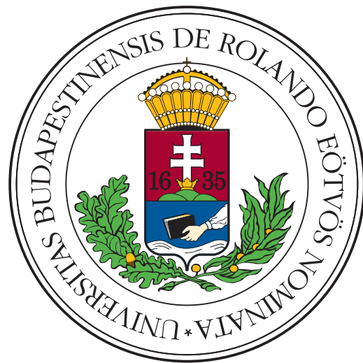
(b) Donec hendrerit quis dui sit amet venenatis