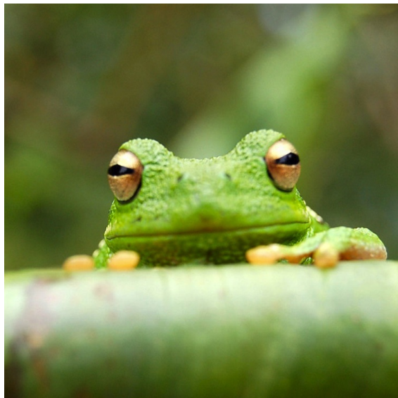
Εικόνα Ε'.1: Βάτραχος

Δείτε το περιεχόμενο του αρχείου appE.tex για τον τρόπο εισαγωγής εικόνων.