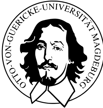
Abbildung: Altes Logo der Universität